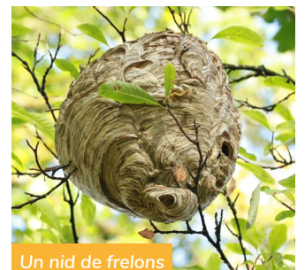
Un nid de frelons

Le Frelon "asiatique" à pattes jaunes, Vespa Velutina , est un frelon invasif originaire d'Asie. Il a été signalé pour la 1 ère fois dans le Lot-et-Garonne en 2004. Les frelons adultes sont brun noir avec des segments abdominaux jaune orangé.