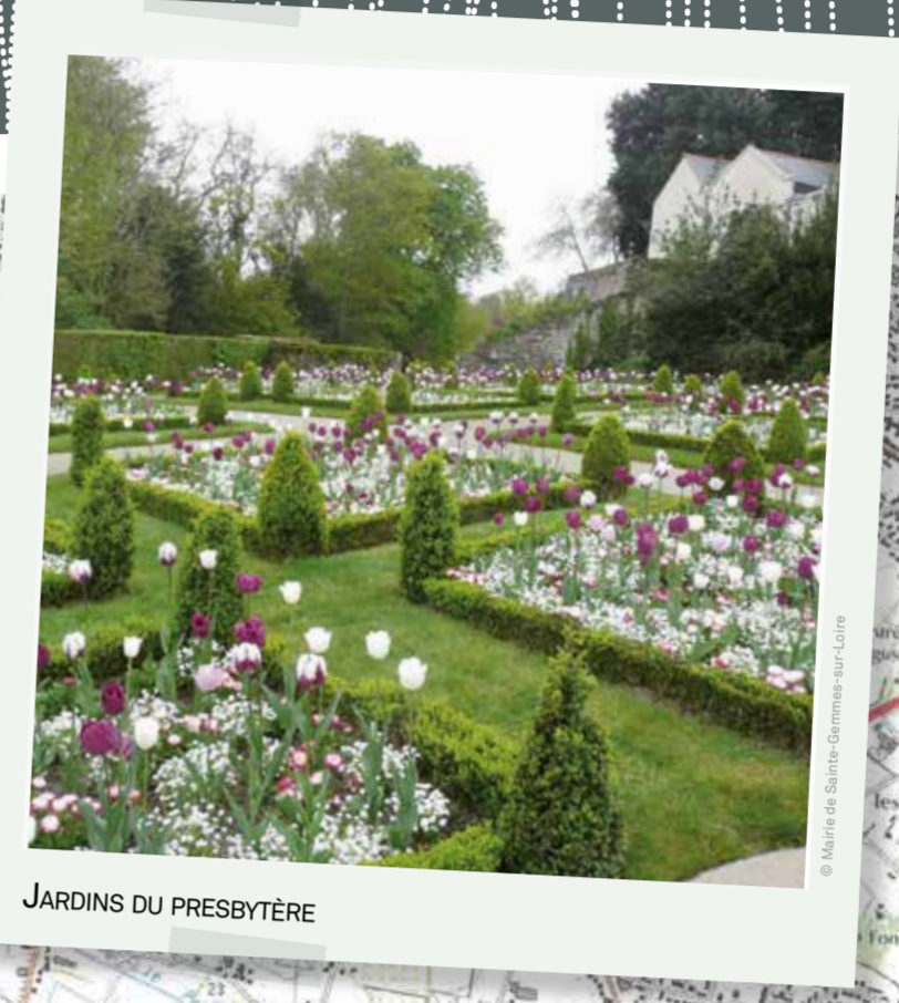
JARDINS DU PRESBYTÈRE