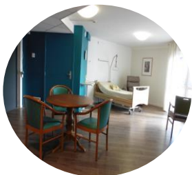
Logement Evolutif pour une Nouvelle Autonomie

Le Logement Evolutif pour une Nouvelle Autonomie , permet un maintien à domicile des personnes avançant en âge, par l'accompagnement à la mise en place d'aide humaines, techniques et matérielles adaptées aux personnes sorties de l'hôpital ou de leur domicile. La durée du séjour est de 21 jours maximum. Le logement LENA se situe au rez-de-jardin du bâtiment principal comporte un espace jour, un espace repos et une salle de douche équipée.