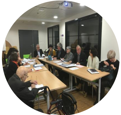
Les membres du Conseil d'Administration

Le Conseil d'Administration est l'organe de décision. Il est composé du maire qui en est le président, de 5 membres du conseil municipal et de 5 personnes qualifiées désignés par le maire. Il se réunit environ une fois par mois pour prendre des décisions concernant la stratégie et la gestion des établissements (budget, poste à pourvoir...).